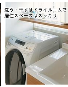
洗う・干すはドライルームで居住スペースはスッキリ