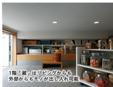
1階「蔵」はリビングからも外部からもモノが出し入れ可能