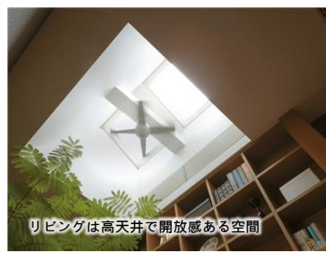
リビングは高天井で開放感ある空間