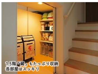
1.5階「蔵」もたっぷり収納各部屋はスッキリ