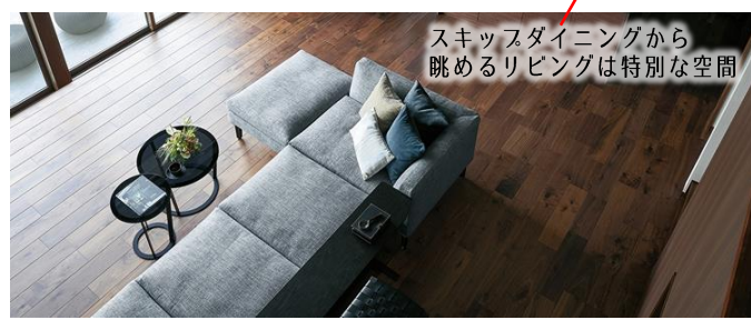
スキップダイニングから眺めるリビングは特別な空間