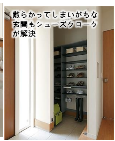
散らかってしまいがちな玄関もシューズクロークが解決