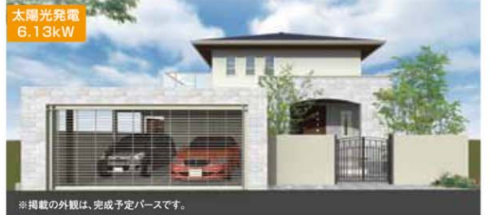
※掲載の外観は、完成予定パースです。