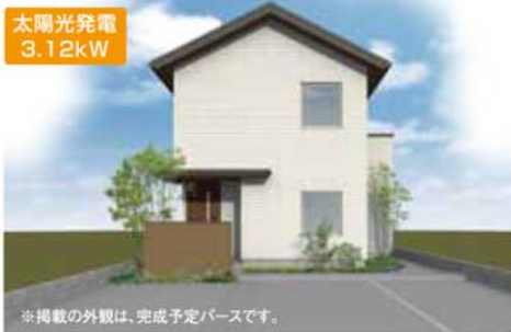
※掲載の外観は、完成予定パースです。